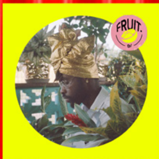
Fruit. EP 2020