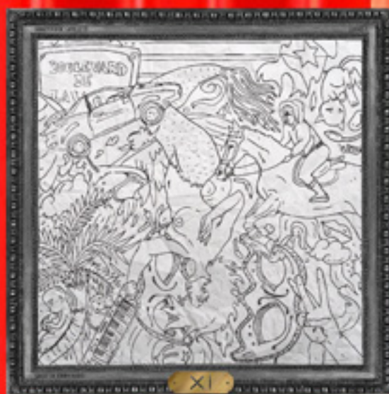
XI Mixtape 2016